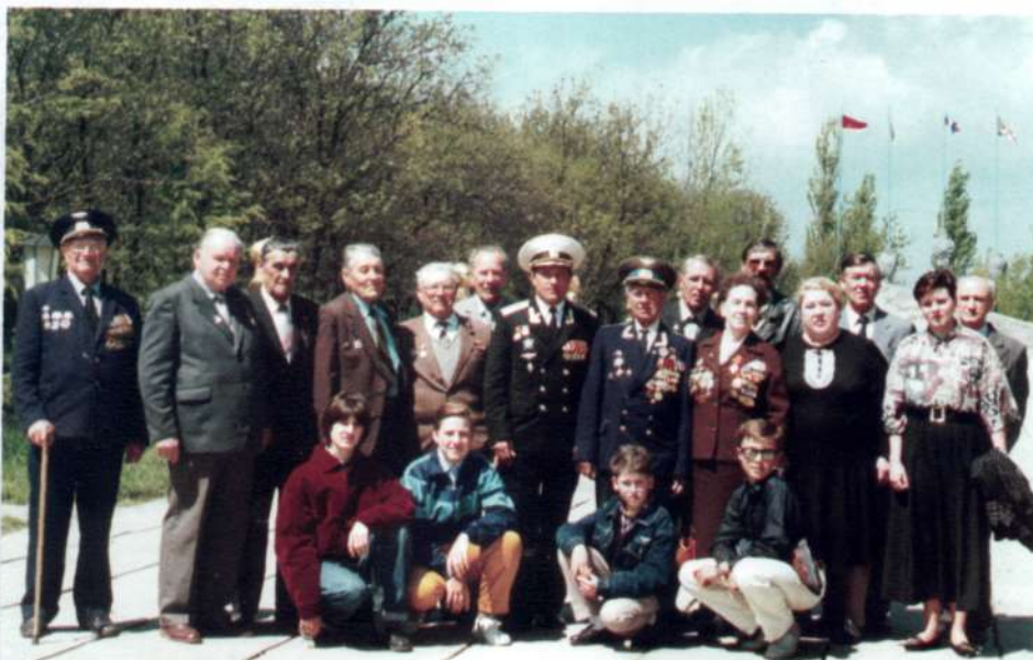
9 мая 2000г. Гвардейский, Крым, 43 иап. Ветераны в родном полку.