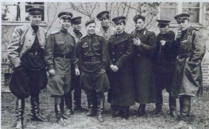
Крым 1944г. май перед взятием Севастополя