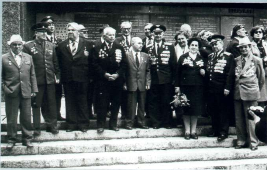
Севастополь, май 1984г Встреча ветеранов 43 иап.