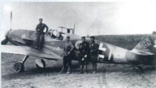
Лётчики полка у трофейного "мессершмитта"