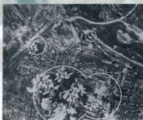
Результаты авианалета на Берлин