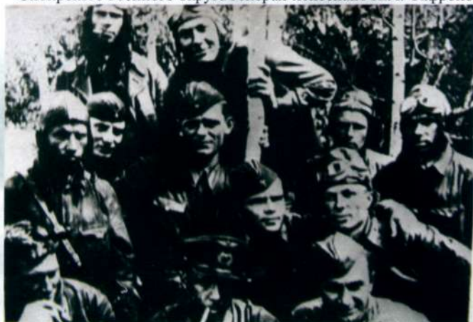
В перерыве между боями лето 1942 года