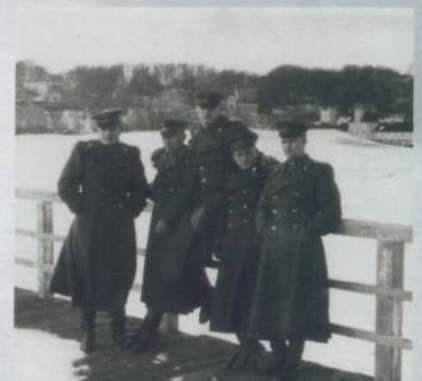
Герингсдорф март 1947г.