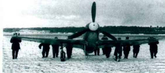
Техники транспортируют самолет в ангар. 1945г.