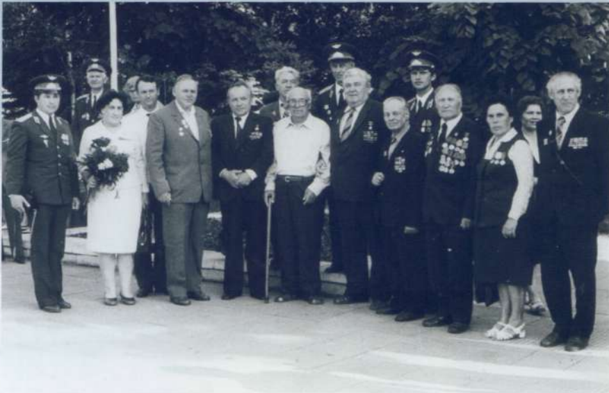
Ветераны 43 иап с молодыми офицерами полка. Краснодар 23 мая 1985 года