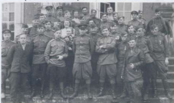
Германия Потсдам май 1945г.