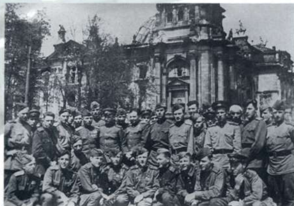
Личный состав 43 ИАП у поверженного Рейхстага. Май 1945г.