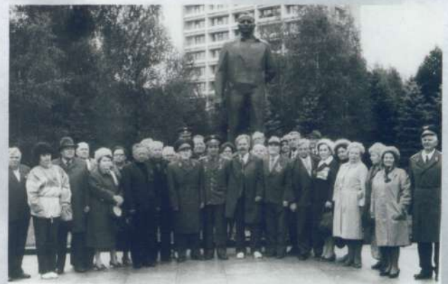
Ветераны в Звездном городке 1984 г.