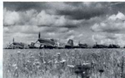
Полевого аэродром базирования 43-го ИАП. Совхоз-Табак. Крым. Май 1944г.