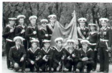
9 мая 1993г. п. Гвардейское у боевого знамени 43 иап