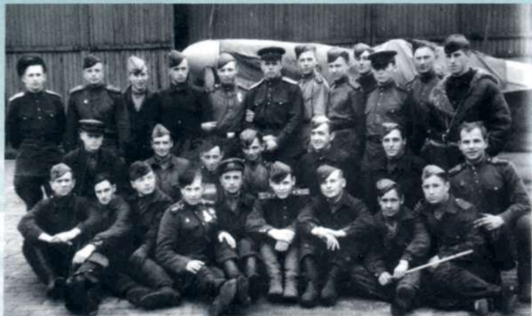
Лётный и технический состав 1 АЭ 43-го ИАП.