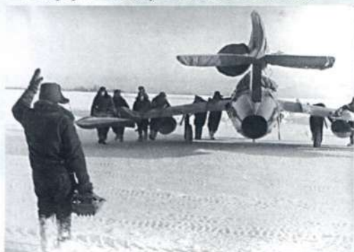
Аэродром Тукумс. Зима 1964 года